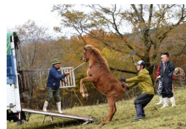
馬運車に乗るのを嫌がる子馬