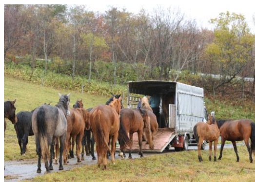
先に山を下りる馬を見送る仲間たち

夏の間トウラクをはずして自由に過ごしていた馬を馬運車に乗せるのは大仕事。馬の性格も様々なので、あの手この手で誘導します。