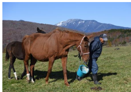
バケツの中身は馬の好物