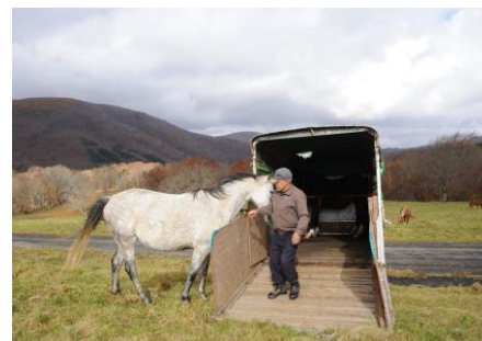
お迎えを待っていた馬も・・・