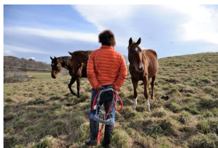
トウラクをつけるタイミング