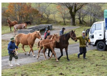
親子馬を馬運車へ誘導