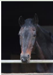
ラバノ オルデンブルグ 1994年ドイツ産 (遠野市畜産振興公社)

2006年ドーハアジア大会馬場馬術団体3位 父系・母系ともに世界的に活躍する産駒を輩出