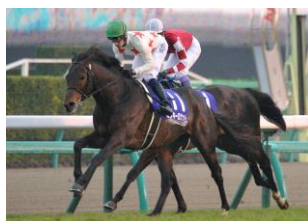
ミッキーロケット サラブレッド 2013年北海道産