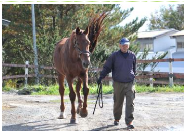
ウエルダン ベルギー温血種 1999年ベルギー産 (遠野市畜産振興公社)

2010年ケンタッキー世界選手権障害馬術日本代表馬 全日本障害馬術大会大障害で活躍