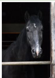
ソル ルシターノ 1999年ポルトガル産 (遠野市畜産振興公社)