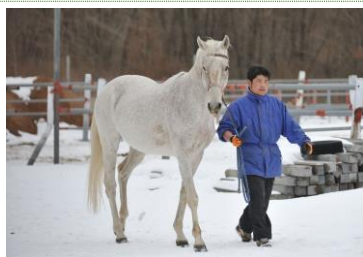
ヤングメドウ アングロアラブ 1994年北海道産 (遠野市畜産振興公社)