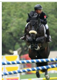
クール AK KNPA 2007年オランダ産(他施設)